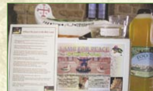
Contenu des kits de «lampes de la Paix»

Malgré l'attachement des villageois à leur Terre, ceux-ci sont poussés à tenter leur chance ailleurs, du fait des difficultés liées au conflit israélo-palestinien et du fait du manque de perspectives d'avenir.