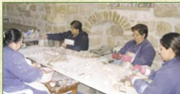
Les « lampes de la Paix » donnent du travail à une vingtaine de personnes

Cette initiative est un outil d'information important sur les conditions de vie auxquelles les communautés chrétiennes de Terre Sainte sont confrontées à cause du conflit.