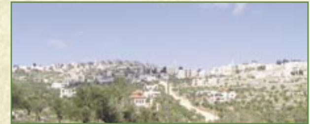
L'initiative vise tout particulièrement à enrayer l'émigration massive dont souffre Taybeh.

Sur les 3400 habitants d'il y a 30 ans, il n'en reste aujourd'hui plus que 1500 à Taybeh.