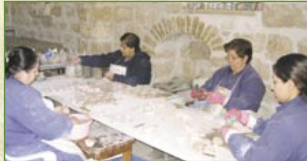
Les « lampes de la Paix » donnent du travail à une vingtaine de personnes

Cette initiative est un outil d'information important sur les conditions de vie auxquelles les communautés chrétiennes de Terre Sainte sont confrontées à cause du conflit.