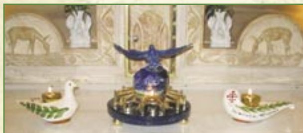
Lampes de la Paix: Modèles «Lampe Traditionnelle» et «Colombe»