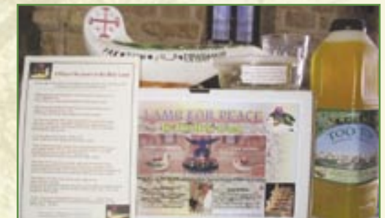
Contenu des kits de «lampes de la Paix»

Malgré l'attachement des villageois à leur Terre, ceux-ci sont poussés à tenter leur chance ailleurs, du fait des difficultés liées au conflit israélo-palestinien et du fait du manque de perspectives d'avenir.