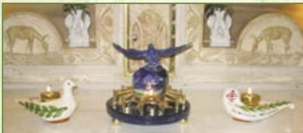
Lampes de la Paix: Modèles «Lampe Traditionnelle» et «Colombe»