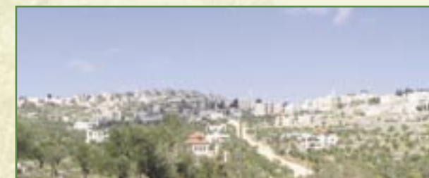
L'initiative vise tout particulièrement à enrayer l'émigration massive dont souffre Taybeh.

Sur les 3400 habitants d'il y a 30 ans, il n'en reste aujourd'hui plus que 1500 à Taybeh.