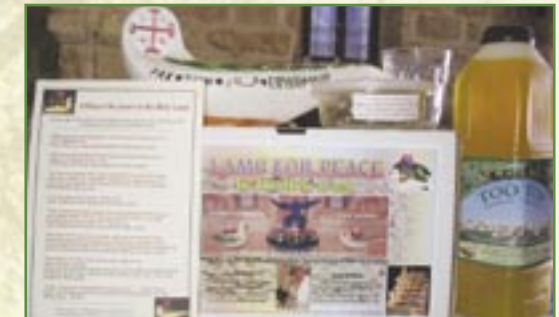
Contenu des kits de «lampes de la Paix»

Malgré l'attachement des villageois à leur Terre, ceux-ci sont poussés à tenter leur chance ailleurs, du fait des difficultés liées au conflit israélo-palestinien et du fait du manque de perspectives d'avenir.