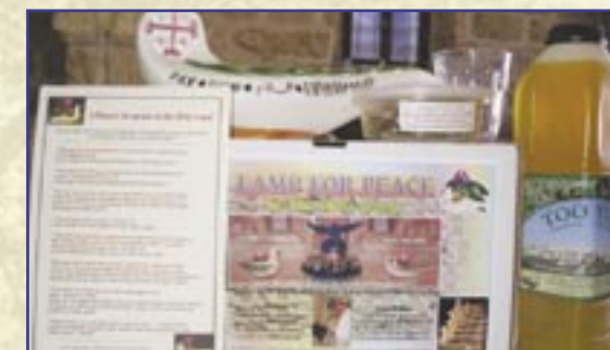
Contenuto del kit della «Lampada della Pace»

Nonostante l'attaccamento degli abitanti alla loro terra, questi sono spinti a cercare altrove altre possibilità di vita, a causa delle difficoltà legate al conflitto israelo-palestinese e alla mancanza di prospettive per il futuro.