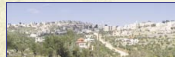
L'iniziativa mira in particolare a fermare l'emigrazione massiccia di cui soffre Taybeh.

Dei 3400 abitanti di trenta anni fa, non ne restano oggi più di 1500 a Taybeh.