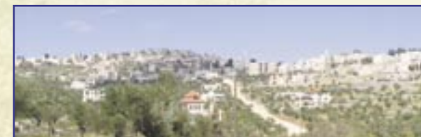
L'iniziativa mira in particolare a fermare l'emigrazione massiccia di cui soffre Taybeh.

Dei 3400 abitanti di trenta anni fa, non ne restano oggi più di 1500 a Taybeh.