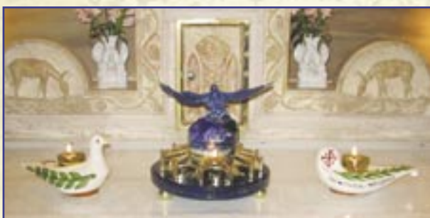
Lampade della Pace: lampada tradizionale e colomba