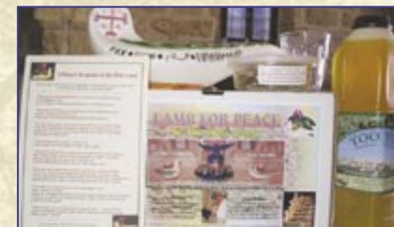
Contenuto del kit della «Lampada della Pace»

Nonostante l'attaccamento degli abitanti alla loro terra, questi sono spinti a cercare altrove altre possibilità di vita, a causa delle difficoltà legate al conflitto israelo-palestinese e alla mancanza di prospettive per il futuro.