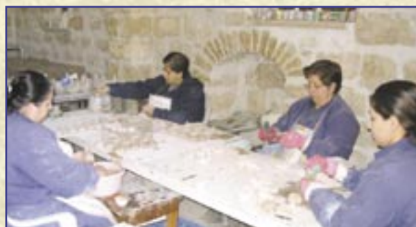
Le «Lampade della Pace» danno lavoro a una ventina di persone

Questa iniziativa è una importante forma di informazione sulle condizioni di vita con le quali le comunità cristiane della Terra Santa si confrontano a causa del conflitto.